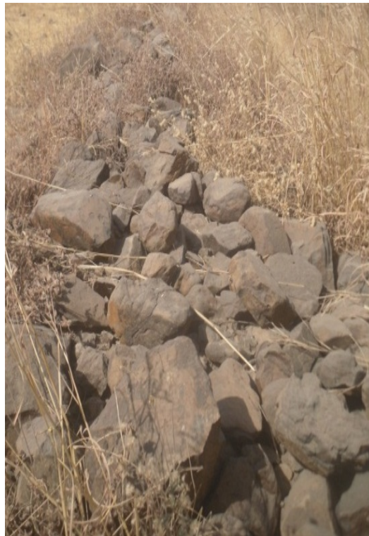
Photo 4 : structure fortifiée de muraille en pierres sèches à Piaga