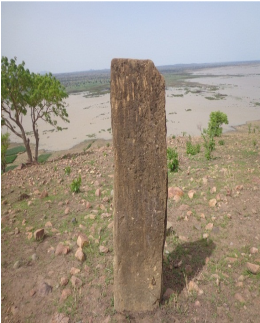
© Saïdou Abdou, juin 2019, Lazoua.