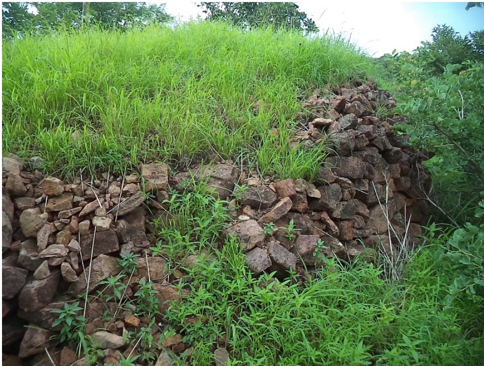
© Saïdou Abdou, mai 2019, Katchéo.

Les murs en pierres sèches servaient de blocus au passage des chevaux des ennemis d'une part et les guerriers se cachaient derrière ces murs pour se protéger contre les flèches des ennemis d'autre part. Ceci dans le but d'avoir une longueur d'avance sur les envahisseurs. Deux murs en pierres sèche sont identifiés à Katchéo. Pour ce qui est de celui de Tara, situé du côté Sud, il est différent de par sa longueur. Ces structures ont duré près de deux siècles. S'il faille se limiter à la seule source orale, ceux-ci sont érigés au XIXe siècle, siècle pendant lequel la conquête peule faisait écho dans toutes les régions du Nord-Cameroun. Les mêmes structures