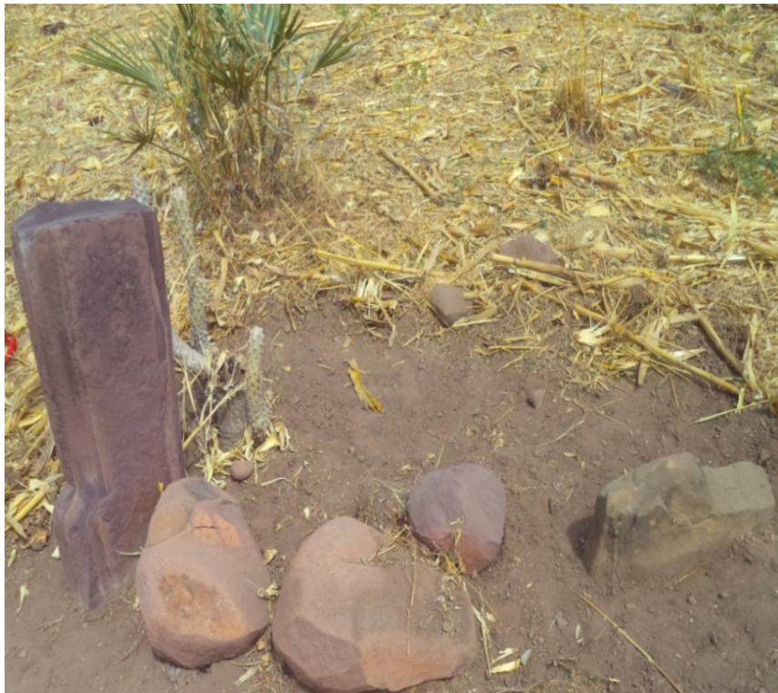
© Saïdou Abdou, janvier 2019, Piaga.