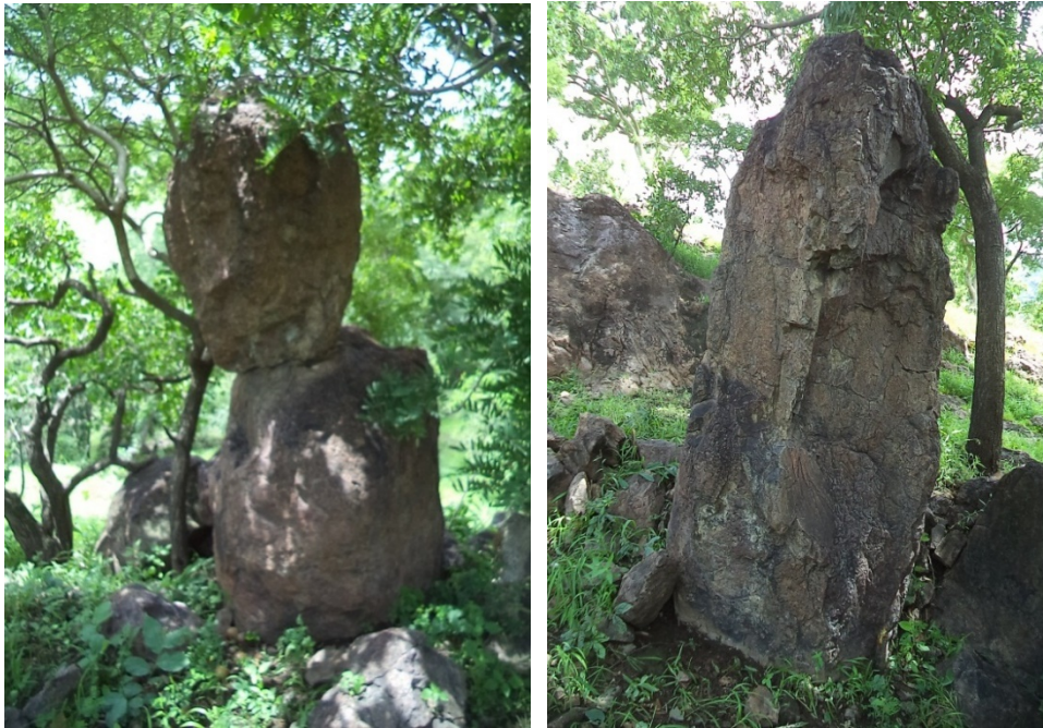
© Saïdou Abdou, juillet 2019, Katchéo.

L'alignement est l'ensemble des pierres plantées dressées en fil, soit sur une même ligne droite, soit en ligne perpendiculaire. F. Paris définit l'alignement comme l'architecture funéraire la plus complexe. Il se caractérise par un fil de pierres plantées orienté du nord au sud dont l'amas et le cercle de pierres se trouvent à l'extrémité (Paris 1995 : 15).