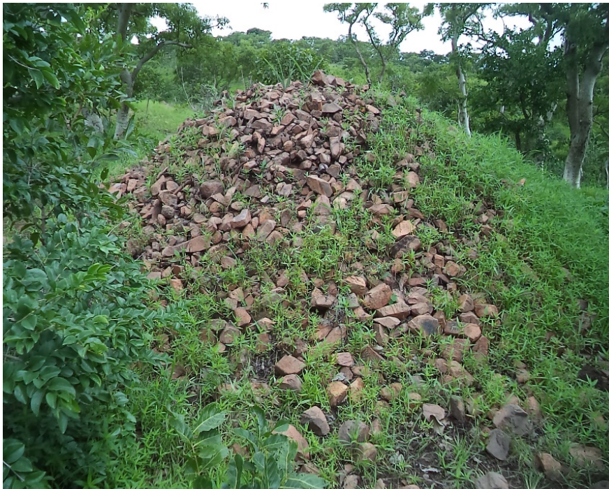
© Saïdou Abdou, juillet 2019, Katchéo