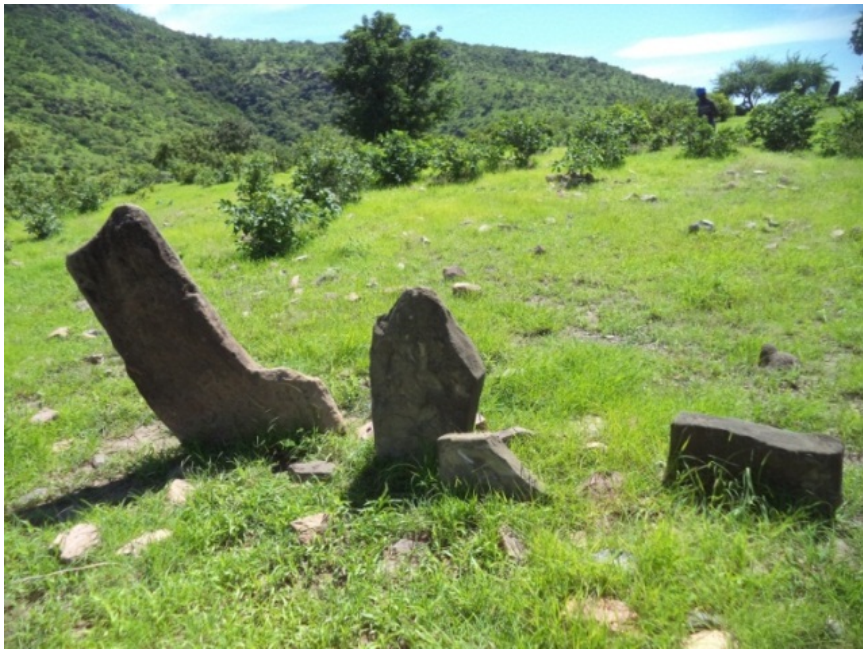
© Saïdou Abdou, juillet 2019, Lazoua.