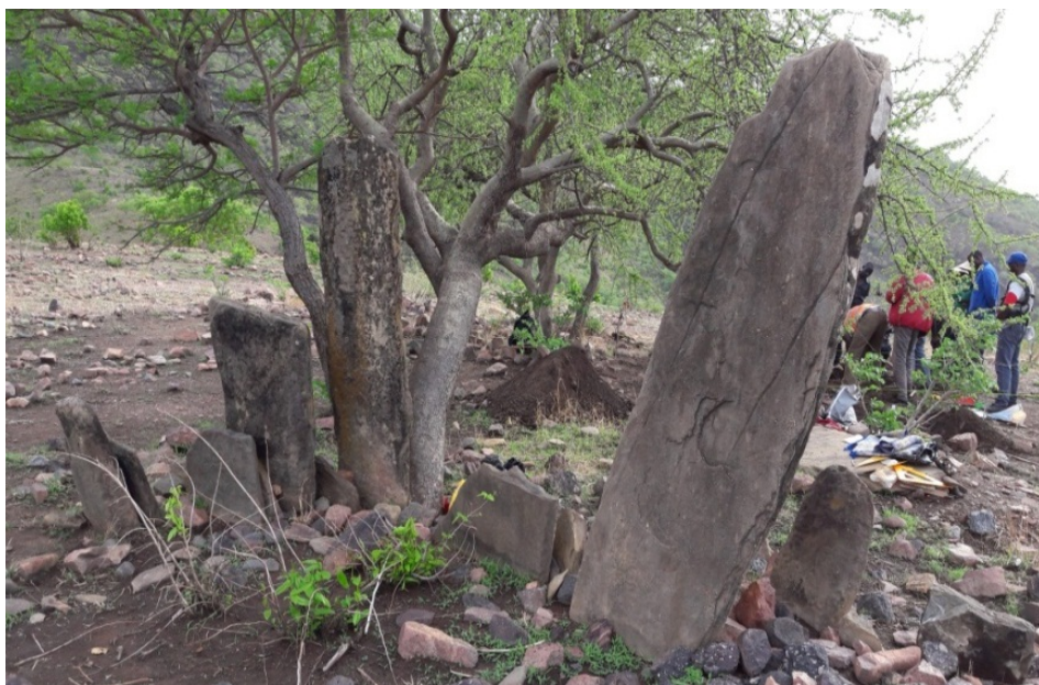
© Saïdou Abdou, juin 2019, Lazoua.